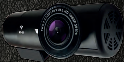
ВИДЕОРЕГИСТРАТОР AV-405 C WIFI PROTECT / СКРЫТОЕ ПОДКЛЮЧЕНИЕ