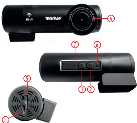
СХЕМА УСТРОЙСТВА ВИДЕОРЕГИСТРАТОРА ARTWAY