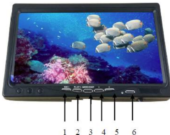
Схема устройства, назначение кнопок

1 - Запись / Корректировка «-» / Переключение источника видеосигнала